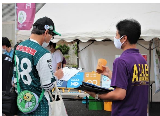
相模原市における実証実験の様子