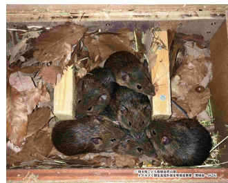
写真1. アマミトゲネズミ

2019年12月からアマミトゲネズミの行動解析を行ってきましたが、途中データ解析ができなかった月もあり、2021年7月までのデータでやっと1年分の解析ができることとなります。現時点ではアマミトゲネズミの行動は日没前後にピークがある夜行性型で、行動は日照時間に影響を受けているようです。また、交尾は日没後に集中することや、幼獣は徐々に成獣と同じ活動リズムになることも明らかになってきました。今後も引き続き行動特性を解析し、繁殖成功のポイントを探ります。