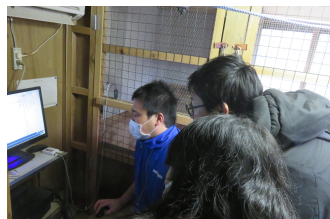
写真2. バックヤードの視察